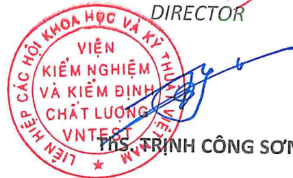
TRẦN TRỊNH CÔNG SƠN