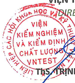
TRỊNH CÔNG SƠN