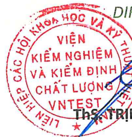
THỊ TRỊNH CÔNG SƠN