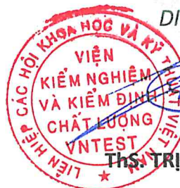
THỊ TRINH CÔNG SƠN