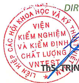
THỊ TRINH CÔNG SƠN