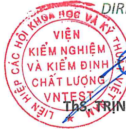
Ths. TRỊNH CÔNG SƠN