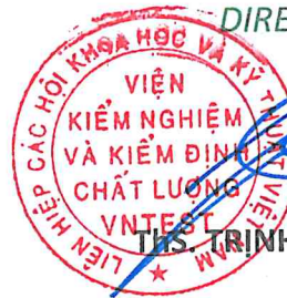
THS. TRINH CÔNG SƠN