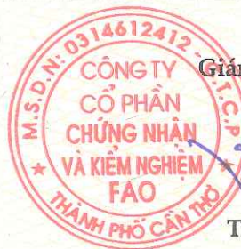
Trần Như Ý